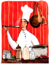
Вече́ром я 2 часа́ гото́вил у́жин.