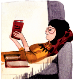
Вчера́ я чита́ла кни́гу.