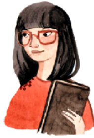
Вчера́ я прочита́ла кни́гу.