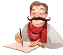
Вчера́ я до́лго писа́л писа́мо.