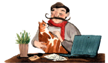
Вчера́ я написа́л писа́мо.