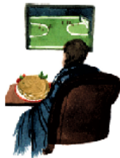
Я пригото́вил вку́сный у́жин!