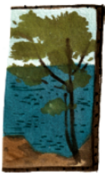
Это карти́на худо́жника Ва́си.