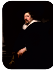
Это автопортрёт знамени́того голла́ндского худо́жника семна́дцатого ве́ка Рúбенса.