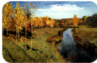
А это карти́на изве́стного ру́сского худо́жника Исаа́ка Левита́на.