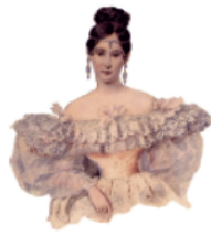
А это портрёт жёны Пúшкина Натáлии Гончарóвой.