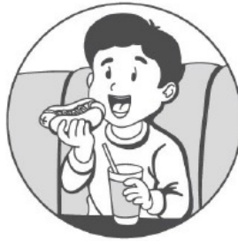
Ты ест /ешь.