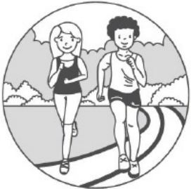
Они бегут /бегу.