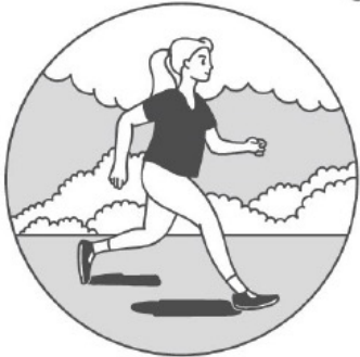
Она бежит /бежим.