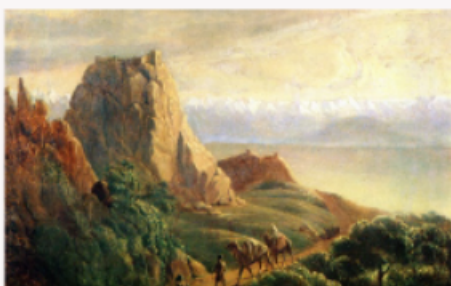
М.Ю. Лермонтов «Окрестности селения Караагач»

Лермонтов рисовал разные картины: пейзажи, портреты, иллюстрации к своим книгам и даже карикатуры. Его лучшие работы — это романтические пейзажи Кавказа. Михаил Лермонтов создал 50 картин и 300 рисунков.