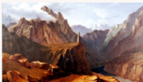
М.Ю. Лермонтов «Кавказский вид возле селения Сиони»