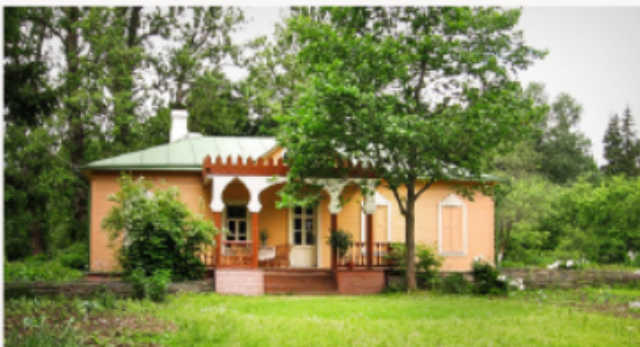
дом А.П. Чехова в Мелихово

Ещё Чехов увлекался 8 ..... (коллекционирование) смешных фамилий, которые использовал в своих рассказах. В его коллекции были такие фамилии, как Чимша-Гималайский, Трахтенбауэр, Проптер, Розалия Аромат, Зевуля.